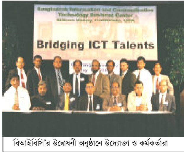
বিআইবিসি'র উদ্বোধনী অনুষ্ঠানে উদ্যোক্তা ও কর্মকর্তারা